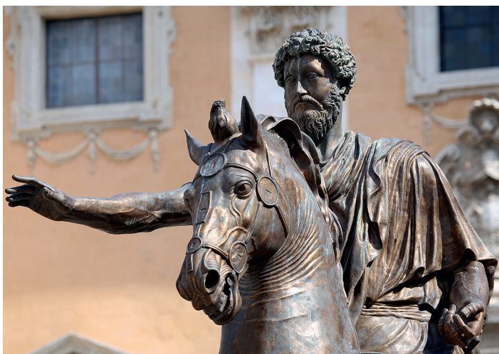
▲ Pomnik Marka Aureliusza

koń imperatora ożyje, nastąpi koniec świata.